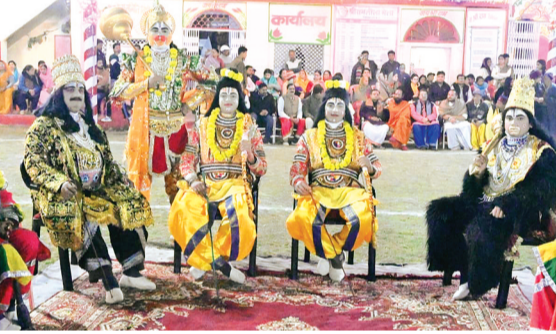
बताया गया कि रावण के पास जब कोई योद्धा नहीं बचा तो उनके मंत्री ने बताया कि मूलों की अभुक्त घड़ी में नारांतक का जन्म हुआ था। नारांतक और सुग्रीम पुत्र दधिबल की शिक्षा गुरु शुक्राचार्य ने संपन्न कराई थी। रणभूमि में नारांतक और