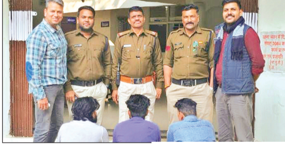
हरिभूमि न्यूज विदिशा