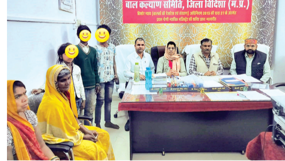
समिति में बुलाया गया। परिजनों को समझाईस दी गई कि भिक्षावृत्ति करना एवं कराना अपराध है। सभी को समझाईस देकर सुपुर्द किया गया। महिला एवं बाल विकास से

भिक्षावृत्ति रोकथाम अभियान के तहत गुरुवार को दुर्गानगर चौराहा से 1 बच्चा एवं बसस्टैंड विदिशा से 2 बच्चों को टीम द्वारा पकड़ा गया। पृष्ठताछ करने पर बताया गया कि तीनों बच्चे सलामतपुर के हैं। भिक्षावृत्ति करते पाये गये सभी बच्चों को बाल कल्याण समिति विदिशा के समक्ष प्रस्तुत किया गया। समिति ने बच्चों के परिजनों से संपर्क कर