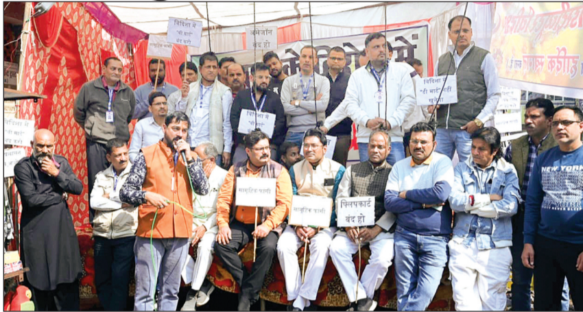
विदिशा। डीमार्ट के खिलाफ प्रदर्शन करते हुए विदिशा नगर के व्यापारीगण।

डिस्ट्रीब्यूटर संगठन के बैनर तले व्यापारी लगातार तीसरे दिन