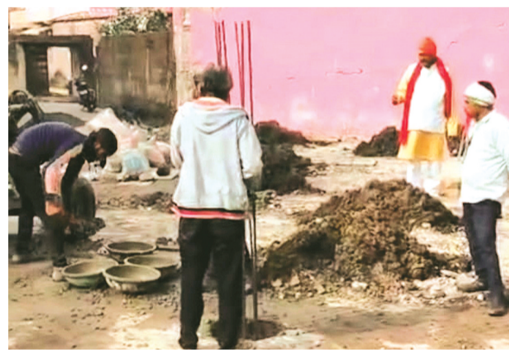
ध्यान इत्यादि की बेहतर व्यवस्थाएं छींठ मंदिर